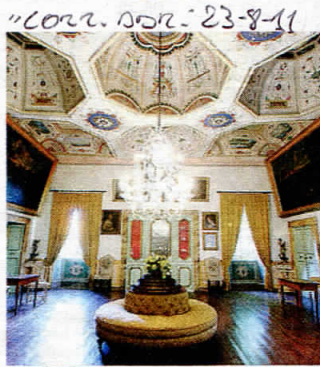
Una sala di Palazzo Castiglioni

Domani pomeriggio alle 18 si inaugurerà la mostra celebrativa "Le stanze di un pontefice", Pio VIII, Francesco Saverio Castiglioni. La mostra, che rimarrà aperta fino al 23 ottobre, è diretta a promuovere e valorizzare la figura del pontefice cingolano il cui operato, forse a causa della sua breve durata (maggio 1829 – novembre 1830), appare poco conosciuto. Inoltre con l'apertura al pubblico delle stanze del Palazzo Castiglioni si vuol evidenziare la ricchezza di un patrimonio storico cingolano certamente pregevole, ma ancora poco