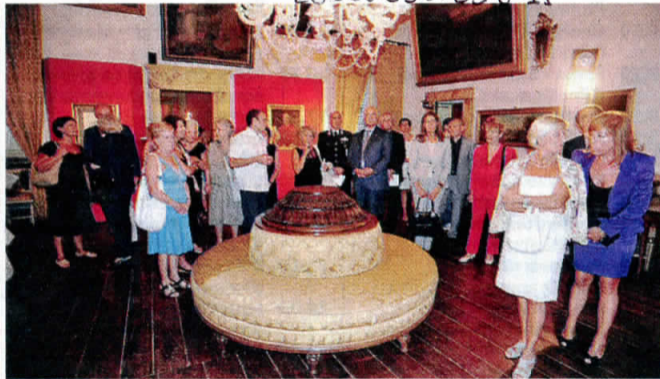
Palazzo Castiglioni ieri dopo l'inaugurazione

Più di 200 persone (tra quelle presenti nella Sala delle Conferenze di Palazzo Cima, dove si è tenuta la presentazione dell'evento e quelle davanti a Palazzo Castiglioni in attesa di visitare - a gruppi di 35 - le stanze del Papa cingolano Pio VIII) hanno partecipato all'inaugurazione della mostra celebrativa "Le stanze di un pontefice" per i 250 anni dalla nascita di Francesco Saverio Ca-